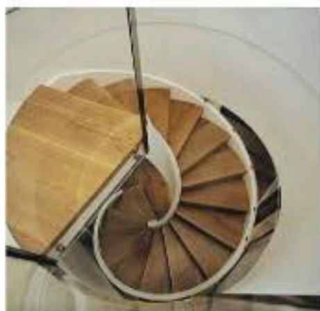
UNA PREGIEVOLE SCALA A CHIOCCIOLO

Tra le opere realizzate dagli antenati si possono menzionare il teatro della Reggia di Caserta e il duomo di Camerino