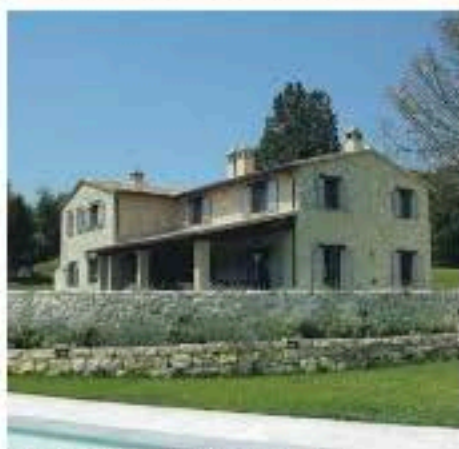
UN CASALE REALIZZATO A TODI IN UMBRIA