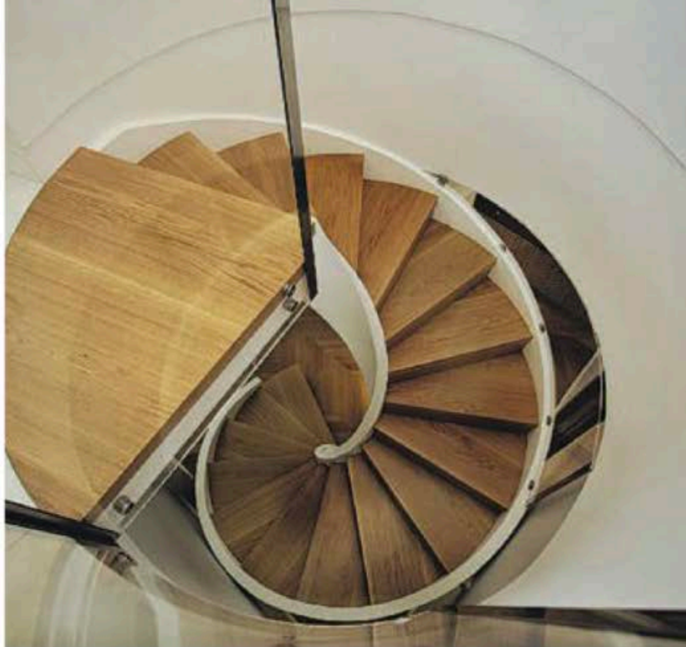
UNA PREGEOLE SCALA A CHIOCCIOLA

dall'unione tra il ra- nizzazione del co- eausire. Quest'ulti- ra, aveva dato origi-